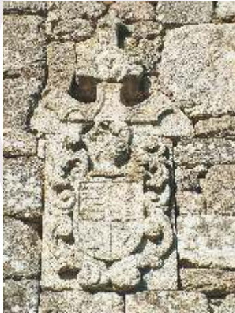
Escudo en Hospital