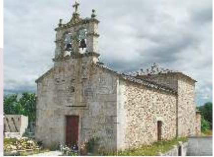
Igrexa do Corgo