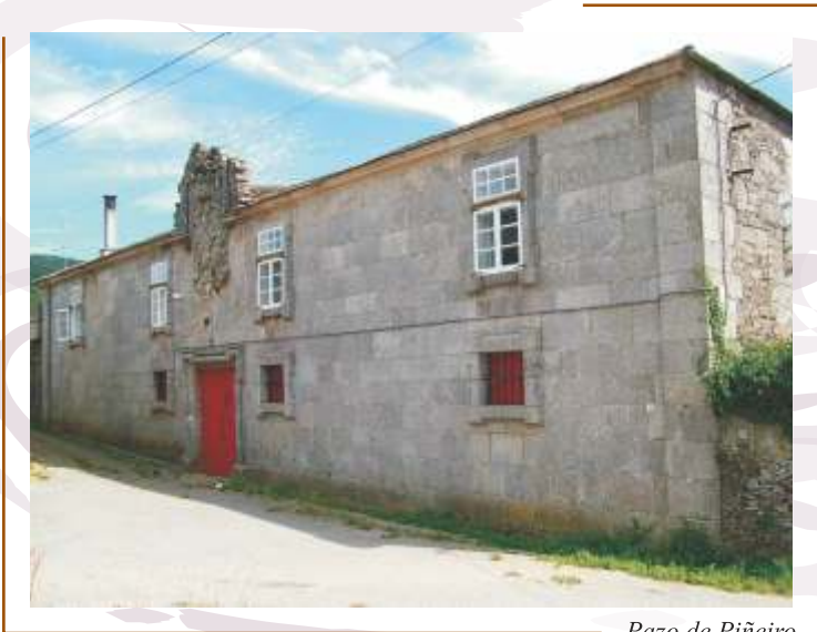
Pazo de Piñeiro