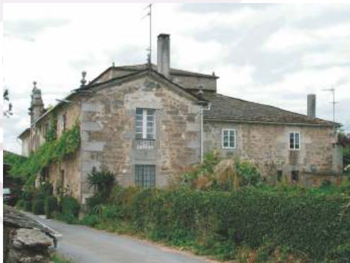
Pazo do Corgo

Ramón Cabanillas (1876-1959) Vento mareiro