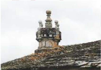
Detalle da cheminea