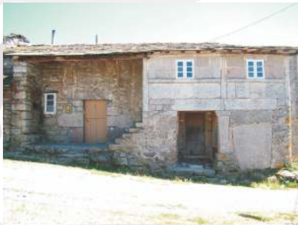
Casa con escudo en Serín