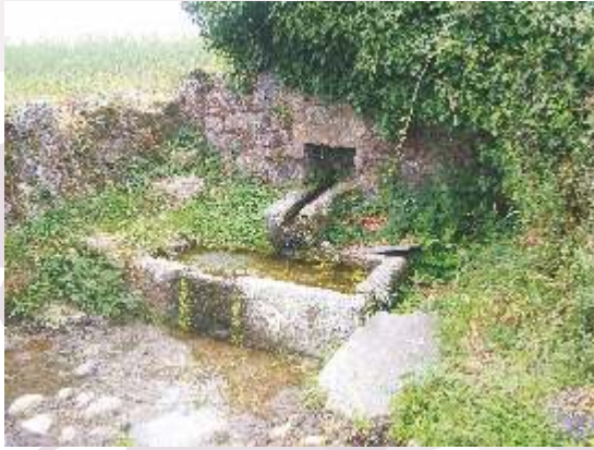
Fonte en Santo André