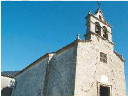
Igrexa de San Fiz