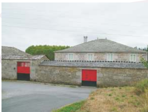
Casa de Díaz en Serín