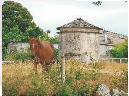
Ponbal da casa de López