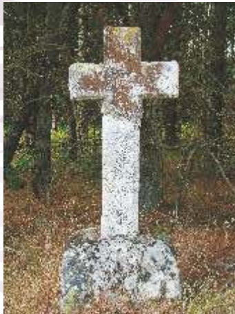
Cruz en Tras da Aira