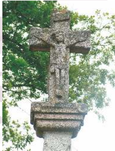
Detalle do cruceiro