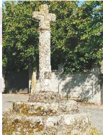
Cruceiro en Hospital