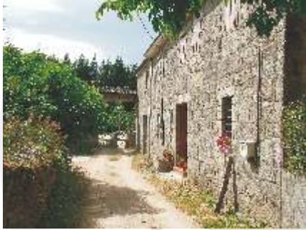
Casa de López en Vilapene