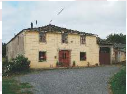
Casa na Vacariza