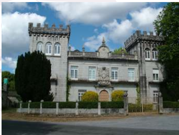
Pazo de Adai