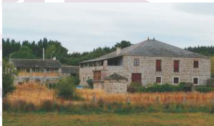
Casa Cardexo de Cerceda (con solaina, ponbal e hórreo)

Subindo na escada social galega, atopamos a casa grande. Soe haber unha ou dúas por parroquia distinguíndose fundamentalmente da anterior tipoloxía pola magnitude, por ter dous andares ben diferenciados, por aparecer elementos ornamentais e por unhas construcións anexas distintas que non existen na casa dun labrego normal. Cunha superficie de terra grande (parte da cal estaba alugada) o "señor" enche en setembro "de gran as paneiras do celeiro ou de capóns cebados a espeteira da cociña como indica Isaac Rielo.