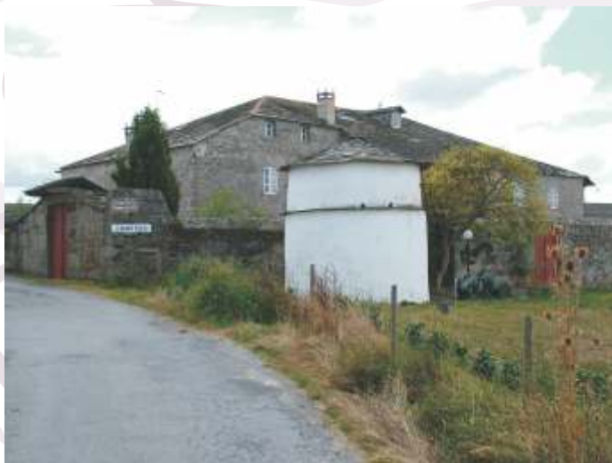
Casa Grande de Camposo