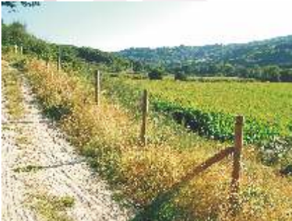
Val do Miño