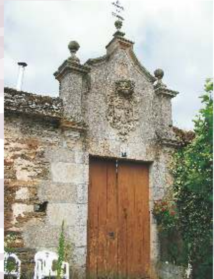
Detalle do portón de entrada