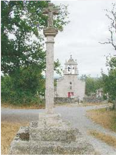
Cruceiro e igrexa de Santo André