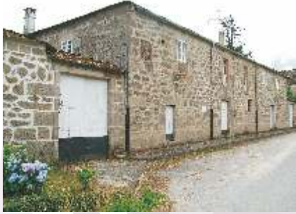
Casa de Neira