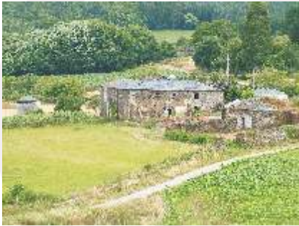
Casa Grande de Quintela