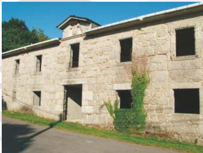
Pazo de Andrade

Magnífica edificación con esquinas e recercados de cantaría e muros de cachotaría que presenta unha ampla solaina na fachada posterior e dous escudos, un deles na fachada principal. A súa rehabilitación (actualmente parada) pódese considerar coma un importante atentado a un ben cultural. Aínda que por dentro este totalmente baleiro viviu un período de suntuosidade que se observa na minuciosa descrición interior que fixo Ánxel Fole no artigo "Buscando pazos" publicado en Faro de Vigo o 1 de xullo de 1953 e recollido no libro "A provincia de Lugo na obra xornalística en castelán de Ánxel Fole", de Ruth Fernández.