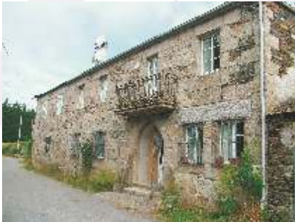
Casa de Troncoso