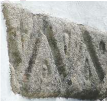
Detalle da pedra alintelada