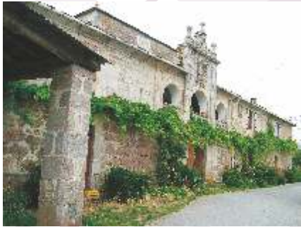
Pazo do Corgo