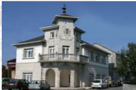
Casa do Concello do Corgo

A casa do Concello do Corgo está situada a pé da N VI no punto medio da "Recta do Corgo" ou "Legua Dereita" no barrio da Portela da parroquia homónima. Para o que veña pola A6 en dirección A Coruña recoméndase desviarse no km 479. Para o que veña en dirección Madrid recoméndase desviarse no km 488.