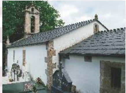
Igrexa de Santalla