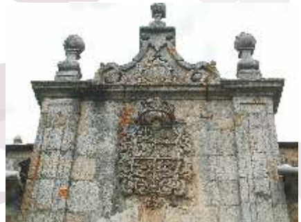
Detalle de Frontón