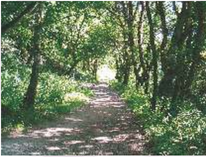
Paso do Miño

A ruta de sendeirismo discorre agora á beira do río Miño nun espazo de gran riqueza natural pertencente á Reserva da Biosfera Terras do Miño (UNESCO, novembro de 2002) augas arriba da Fraga da Fervenza. Paseo agradable entre prados de ribeira e fragas centenarias para relaxarse e admirar a flora e a fauna típicas dun ecosistema fluvial ben integrado coa actividade agraria.