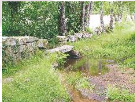
Pontella do Mazandán