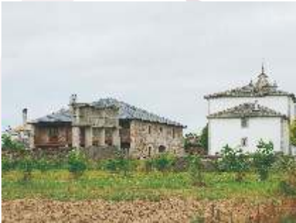
Igrexa e casas grandes en San Pedro