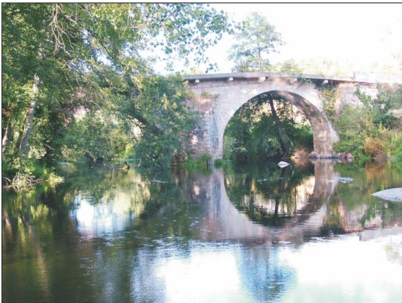
Ponte de Neira